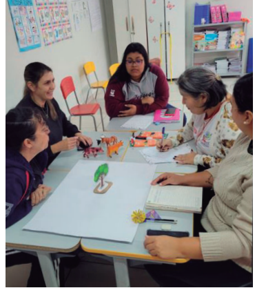
Formação envolveu professores da rede

prefeito Fernando Itapuã para a área da educação, com foco na formação continuada dos educadores e no aperfeiçoamento das práticas aplicadas em sala de aula.