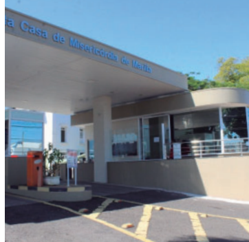
Hospital emitiu nota sobre alta ocupação

Segundo o hospital, a sobrecarga atinge temporariamente a estrutura de assistência intensiva, área destinada ao atendimento de pacientes em estado mais grave ou que exigem acompanhamento contínuo e maior suporte das equipes de saúde. A instituição informou que a situação está re-