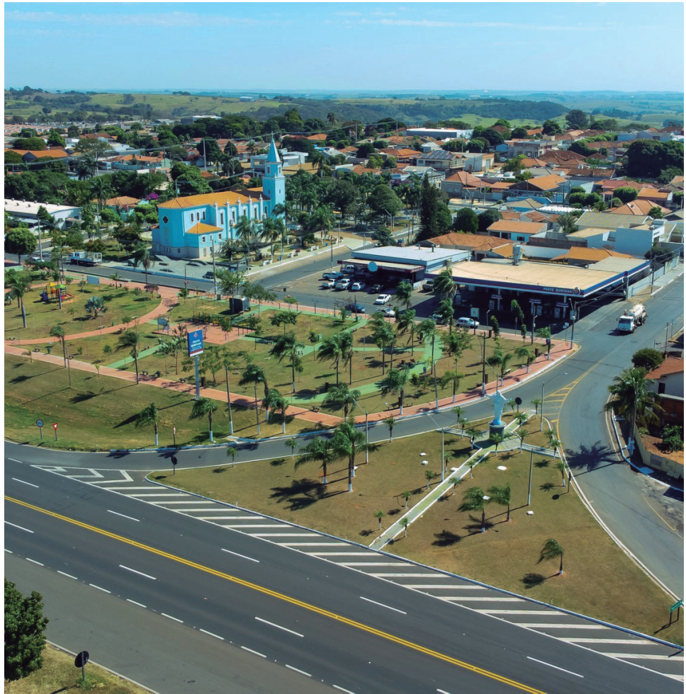
Município alcançou a 36ª colocação nacional no IPS, índice que avalia indicadores sociais e bem-estar da população

Quintana reforça o preparo para período de estiagem P2