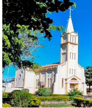
Município conquistou nota máxima

dimensões avaliadas, além de poucos registros de pontuação parcial, itens não pontuados ou indicadores classificados como não aplicáveis ao exercício.