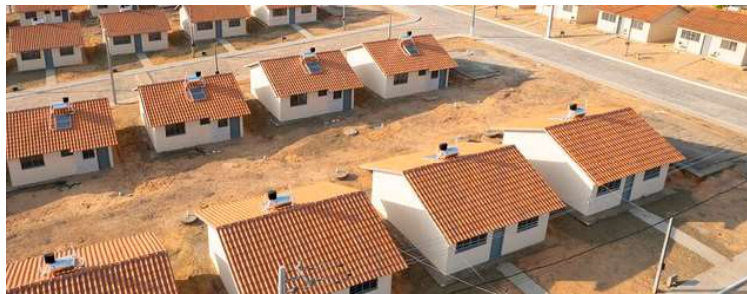
Casas ilustrativas do Minha Casa, Minha Vida; município terá 20 novas moradias

O investimento estimado é de R$ 3.225.793,36. Os recursos estão vinculados ao repasse federal, por meio do Ministério das