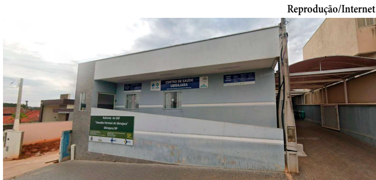
Centro de Saúde de Ubirajara; profissional deve orientar população em atividades

De acordo com o edital, o profissional contratado deverá atuar no desenvolvimento de atividades físicas e práticas corpo-