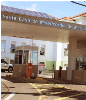
Santa Casa de Marília lidera repasses

dos Direitos da Criança e do Adolescente).