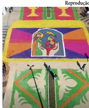
Tradicionais tapetes pelas ruas da cidade

Além do significado religioso para os católicos, a ce-