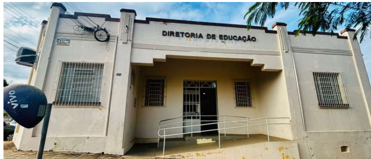
Diretoria de Educação será responsável por definir cronograma de implantação

O decreto também autoriza que as atividades sejam desenvolvidas por professores, monitores, instrutores, profissionais especializados ou parceiros institucionais, sempre sob coordenação da Diretoria Municipal de Educação e de acordo com a legislação vigente.