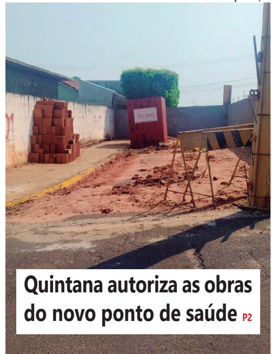
Quintana autoriza as obras do novo ponto de saúde P2