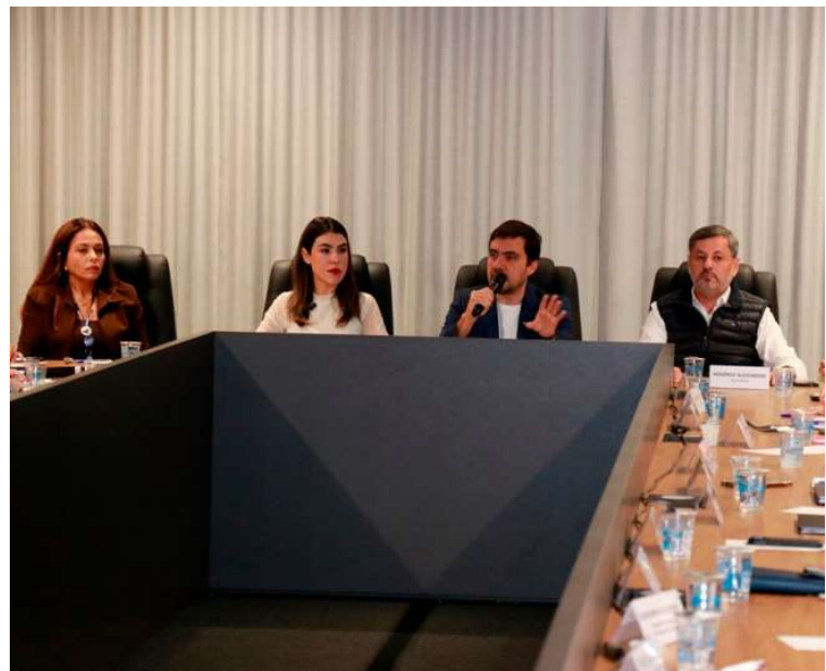
Reunião apresentou as atividades desenvolvidas pelas secretarias no mês de junho