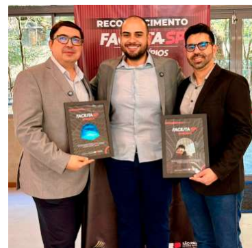
Cidade recebeu selos Prata e Inovação

Valor da publicação: R$ 126,00. Conforme Lei Municipal Nº 2.650, de 30 de março de 2016