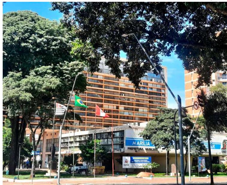
Programa permite pagamento à vista ou parcelado de pendências em dívida ativa

Segundo o prefeito Vinicius Camarinha, a proposta busca facilitar a regularização de pendências junto ao município. “Estamos propondo desconto de 40% a 90% nos valores de juros e multas, com parcelamento em até 60 vezes. É uma