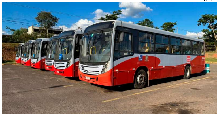
Emdurb contrata empresa especializada para realizar os estudos técnicos