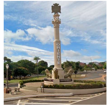
Município vai investir na iluminação