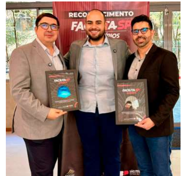
Cidade recebeu selos Prata e Inovação

Valor da publicação: R$ 126,00. Conforme Lei Municipal Nº 2.650, de 30 de março de 2016