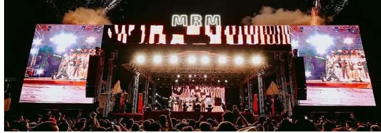
Registro da edição de 2024 do rodeio de Marília, realizado em área de Lácio

Pelo edital, a empresa vencedora pagará ao município pelo direito de uso temporário da área e assumirá a execução completa da feira, incluindo montagem, desmontagem, infraestrutura, segurança, logística, operação e