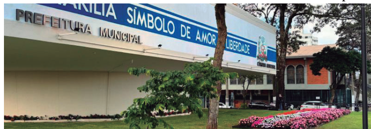
Atendimento municipal terá mudanças entre quinta-feira (9) e domingo (12)

o feriado prolongado a Prefeitura Municipal, as secretarias municipais, o Ganha Tempo, o Procon, as unidades de saúde,