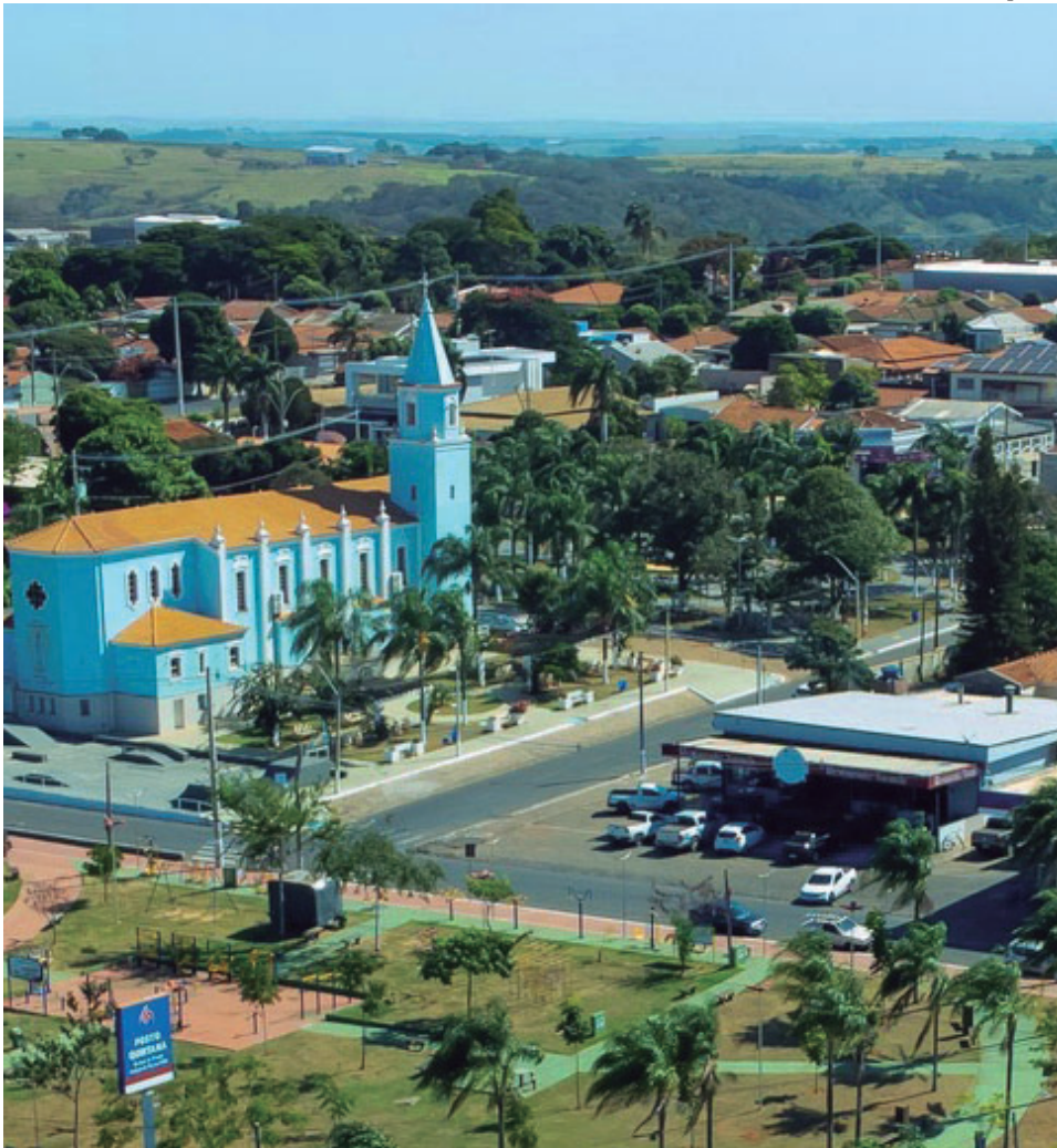
QUINTANA INICIA NOVA ETAPA DE RECAPEAMENTO NA CIDADE P5