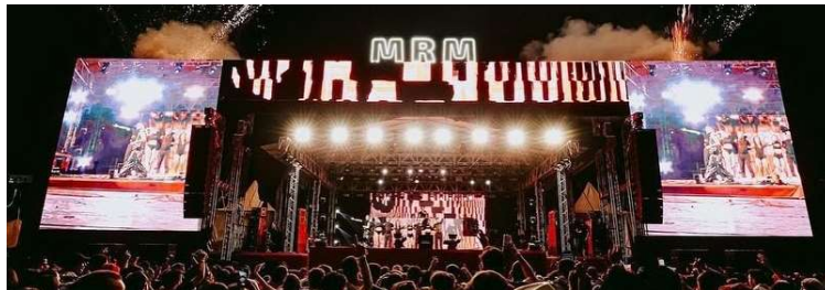
Registro da edição de 2024 do rodeio de Marília, realizado em área de Lácio

Pelo edital, a empresa vencedora pagará ao município pelo direito de uso temporário da área e assumirá a execução completa da feira, incluindo montagem, desmontagem, infraestrutura, segurança, logística, operação e