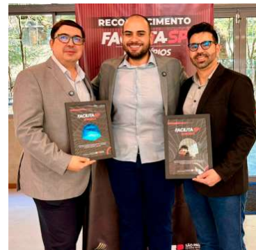
Cidade recebeu selos Prata e Inovação

Valor da publicação: R$ 126,00. Conforme Lei Municipal Nº 2.650, de 30 de março de 2016