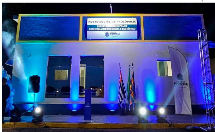
Unidade em Paulópolis oferece atualmente acesso direto da população a 11 serviços

ximar o atendimento da população do distrito, permitindo que demandas ligadas à assis-