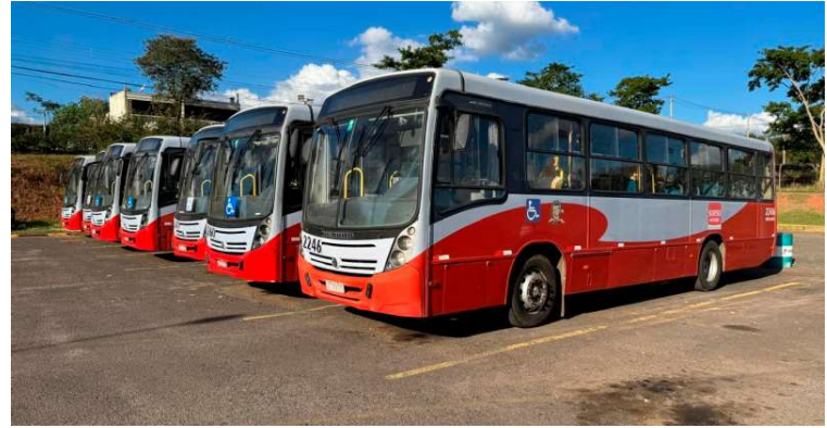
Emdurb contrata empresa especializada para realizar os estudos técnicos