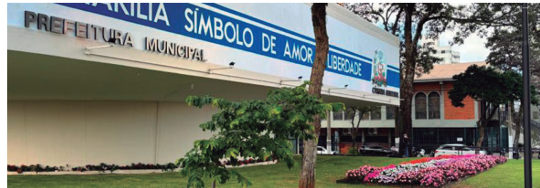
Atendimento municipal terá mudanças entre quinta-feira (9) e domingo (12)

o feriado prolongado a Prefeitura Municipal, as secretarias municipais, o Ganha Tempo, o Procon, as unidades de saúde,