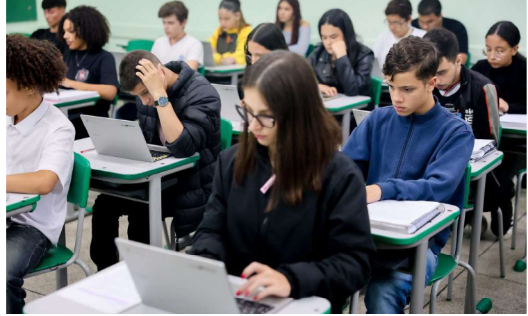
5.000 kits tecnológicos chegarão às unidades regionais de ensino até o mês de outubro