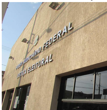
Justiça de Marília vai marcar recontagem

horário da audiência de retotalização. Conforme apurado pela reportagem, ainda não há previsão para a realização do procedimento.