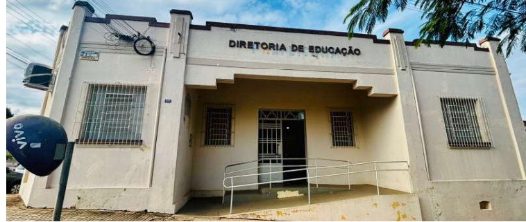
Diretoria de Educação será responsável por definir cronograma de implantação

O decreto também autoriza que as atividades sejam desenvolvidas por professores, monitores, instrutores, profissionais especializados ou parceiros institucionais, sempre sob coordenação da Diretoria Municipal de Educação e de acordo com a legislação vigente.